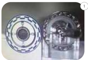
Photo 1. Vérification d'assemblage et stockage d'images

Les tests, les contrôles et le suivi garantissent la qualité: chaque agrafeuse doit réussir un test de tir avant d'être placée sur le site marché. En plus, chaque agrafeuse et cartouche est photographiée et stockée pour QMS suivi, pour s'assurer que chaque agrafe a été correctement positionnée. De l'usine aux mains du chirurgien, Panther Médical Canada assure la sécurité et la qualité des produits lors de chaque intervention chirurgicale.